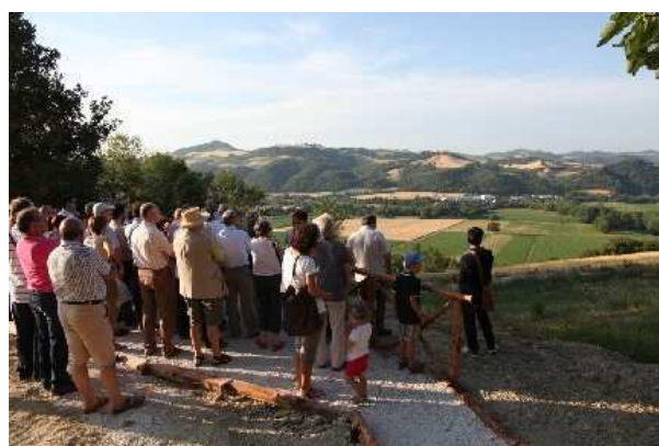
Veduta dal Balcone

Inaugurazione a Pieve del Colle di Urbania. Ricci: "Il nostro territorio è un immenso patrimonio culturale, che va sempre più valorizzato e fatto conoscere a cittadini e turisti"